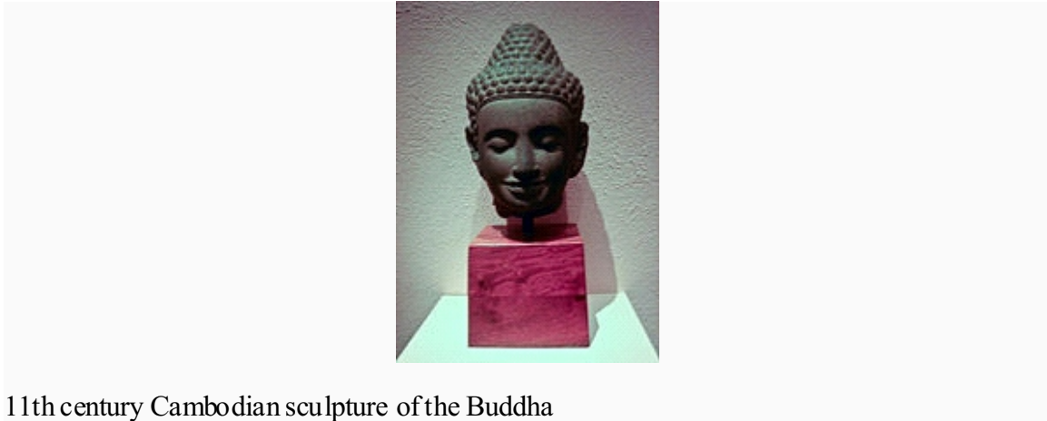
11th century Cambodian sculpture of the Buddha

60 m above the plain on which Angkor sits. Under Yasovarman I the East Baray was also created, a massive water reservoir of 7.5 by 1.8 km.