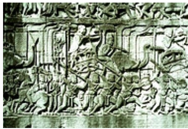
Archers mounted on elephants